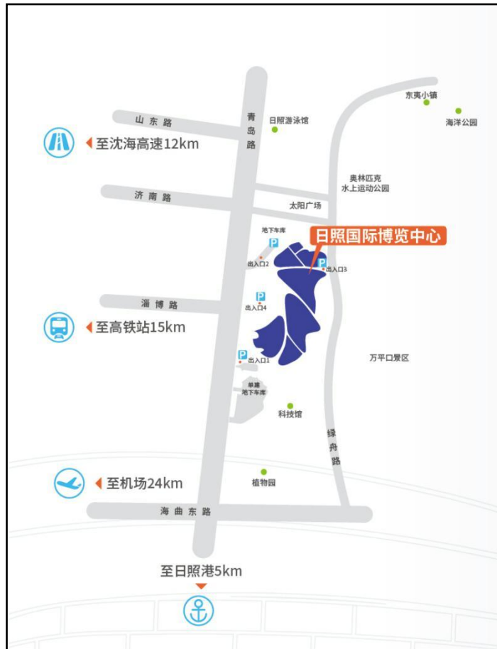
图 1 日照国际博览中心位置示意